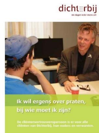
Jaarverslag 2016 Team cliëntenvertrouwenspersonen

De cliëntenvertrouwenspersonen zijn dagelijks te bereiken van 9.00 - 17.00 en op maandagavond van 18.00 - 20.00. Op de website kunt u zien welke vertrouwenspersoon er per dag beschikbaar is.